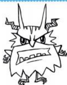
COLÈRE - Rouge