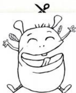
JOIE - Jaune